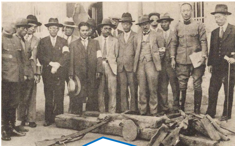
日军指属于中国士兵的一支步枪、一顶军帽及两根枕木。